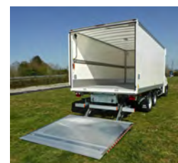
Poids Lourd 7T5