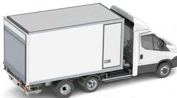
Exemple configuration n°5 Fourgon 18 m3 avec hayon