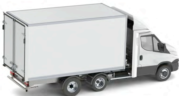
Exemple configuration n°1 Fourgon 18 m3 avec double porte arrière

* Charge utile à titre indicatif. Dépend du poids de la carrosserie à confirmer par le carrossier frigorifique. Largeur intérieure standard : 2050 mm Hauteur intérieure : 1950 mm. Pour passer sous les péages, prévoir une hauteur intérieure de 1850 mm Modèle de hayon : Hayon rabattable Dhollandia DHLMA.10 / Hayon rabattable repliable BÄR Free Access