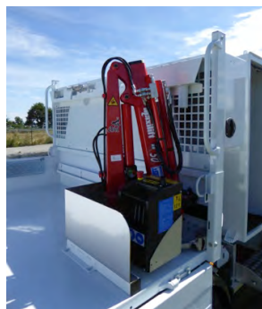
Potence MAXILIFT M50 Capacité 500 kg Véritable petite grue hydraulique avec boîtier de commande