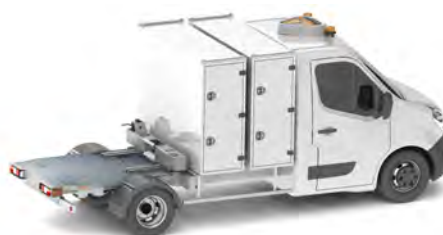
Véhicule 3T5 1 carte grise Charge utile : 700 kg