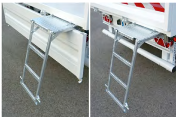
Escalier escamotable avec plateforme de sécurité