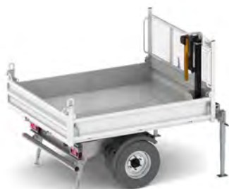
Remorque 3T5 1 carte grise Charge utile : 2.000 kg

Exclusivité : Deux grands coffres → Meilleure organisation