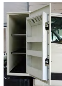
Coffre aluminium technique avec étagères de porte pour le petit outillage