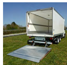
Poids Lourd 7T5