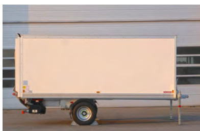
Maxicargo 3T5 + 3T5