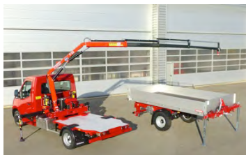
Dételage de la remorque en 2 minutes