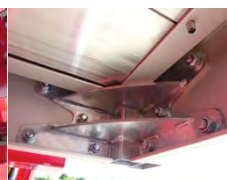
Renfort dans les angles