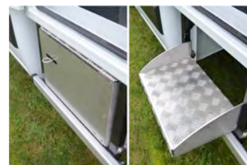
Marchepied antidérapant pour l'accès au coffre