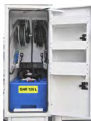
Options de coffre