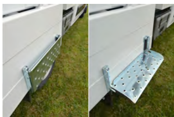
Large marchepied antidérapant