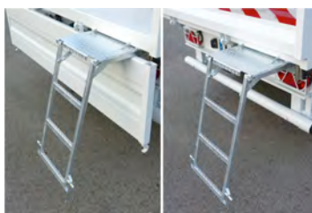
Escalier escamotable avec plateforme de sécurité